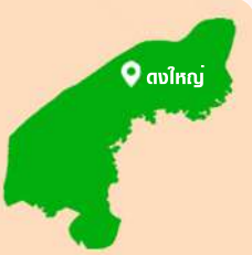
แผนที่ตำบลดงใหญ่

ตำบลดงใหญ่แบ่งเขตการปกครองออกเป็น 20 หมู่บ้าน พื้นที่ทั้งหมด 52,768 ไร่ หรือ 52,768 ตารางกิโลเมตร จำนวนครัวเรือนทั้งหมด 2,587 ครัวเรือน ประชากรทั้งสิ้น 7,678 คน แยกเป็นชาย จำนวน 3,665 คน เป็นหญิง จำนวน 4,013 คน ลักษณะ-ลักษณะพื้นที่เป็นที่ราบลุ่มเหมาะสำหรับการเกษตร ลักษณะของดินเป็นดินร่วนปนทราย ดินเหนียว ดินเหนียวปนทราย กักเก็บน้ำได้ปานกลางเหมาะแก่การเพาะปลูกข้าว ลักษณะของแหล่งน้ำแหล่งน้ำธรรมชาติที่สำคัญ จำนวน 2 สาย คือ แม่น้ำมูลและลำน้ำแคว มีโครงการชลประทานทุ่งสัมฤทธิ์ช่วยส่งน้ำเพื่อใช้ในการเกษตร