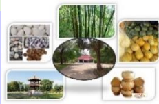
ประชากรทั้งหมด