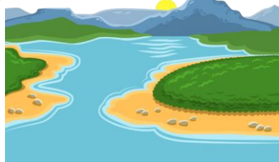
มีแม่น้ำนครชัยศรี (ท่าจีน) ไหลผ่านบริเวณหมู่ที่ 2 , 4 , 5 , 7