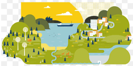
มีพื้นที่ 12.847 ตารางกิโลเมตร