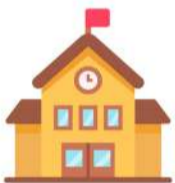
โรงเรียน 6 แห่ง

กำนัน ผู้ใหญ่บ้าน โรงเรียน วัด โรงพยาบาลส่งเสริมสุขภาพตำบล อบต. ธรรมศาลา สำนักงานส่งเสริมการศึกษานอกระบบและการศึกษาตามอัธยาศัย - สภาพโดยทั่วไปของชาวบ้านตำบลธรรมศาลามีลักษณะเป็นสังคมเมือง ส่วนใหญ่จะประกอบอาชีพ พนักงานบริษัท ข้าราชการ และรับจ้างทั่วไป