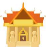
วัด 1 แห่ง