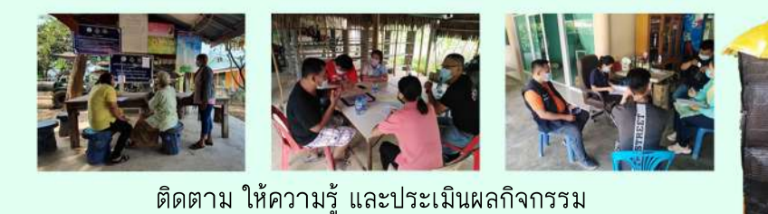
ติดตาม ให้ความรู้ และประเมินผลกิจกรรม