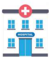
รพ.สต. 2 แห่ง