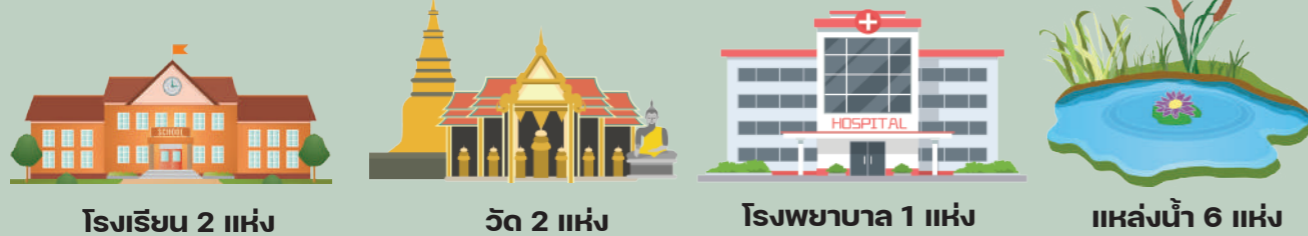
โรงเรียน 2 แห่ง

หรือ แม่น้ำท่าจีนไหลผ่าน เหมาะแก่การเพาะปลูก ทำนา ทำสวน ทำไร่ ตลอดจนการเลี้ยงสัตว์และการประมงน้ำจืด มีคลองต่าง ๆ เชื่อมโยงกัน