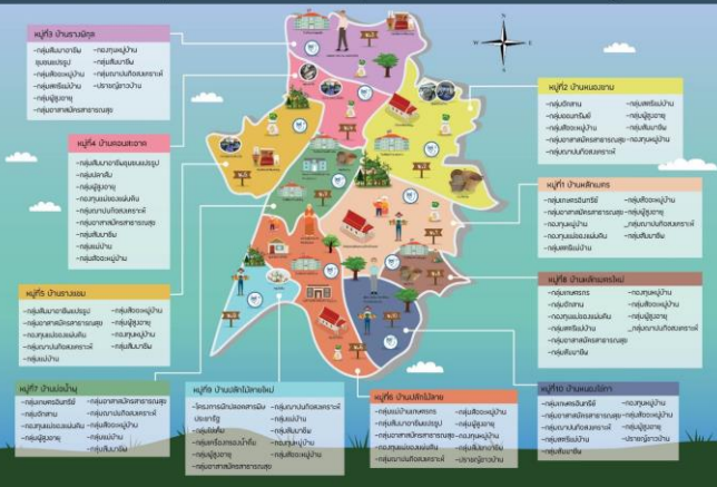
แผนที่แสดงกวนวสันและศักยภาพ ตำบลทุ่งขวาง อำเภอกำแพงแสน จังหวัดนครปฐม