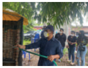
ถ่ายทอดองค์ความรู้การเพาะเห็ดในชุมชนที่ทาง มหาวิทยาลัยราชภัฏนครปฐมได้ออกแบบ ให้เหมาะสมกับการติดตั้งในพื้นที่