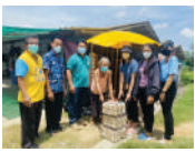
จัดตั้งชุมชนและส่งเสริมกลุ่มเป้าหมายครัวเรือนเพื่อการพัฒนา