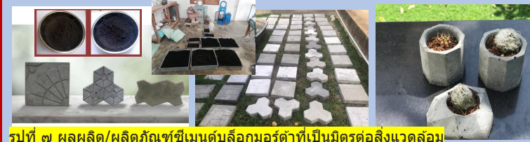
รูปที่ ๗ ผลผลิต/ผลิตภัณฑ์ซีเมนต์บล็อกมอร์ตาร์ที่เป็นมิตรต่อสิ่งแวดล้อม