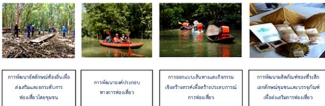
การพัฒนาวิถีชีวิตของนิเวศนิเวศ ส่งเสริมและยกระดับการท่องเที่ยวเชิงนิเวศ การพัฒนาและยกระดับการท่องเที่ยวเชิงนิเวศ การพัฒนาและยกระดับการท่องเที่ยวเชิงนิเวศ

โครงการส่งเสริมและยกระดับการท่องเที่ยวเชิงนิเวศแบบบูรณาการอย่างยั่งยืนผ่านการมีส่วนร่วมของชุมชนเพื่อพัฒนาเชิงนิเวศทางเศรษฐกิจในตำบล