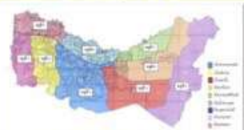
แผนที่อาณาบริเวณตำบลหนองบัว