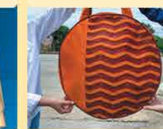
กระเป๋าผ้าทอสีส้ม