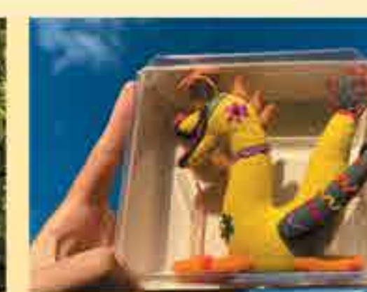
ตุ๊กตาดาวดวง