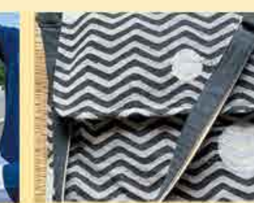
กระเป๋าผ้าทอ สายทรงกลม