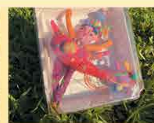
ตุ๊กตานางเงือกผ้า