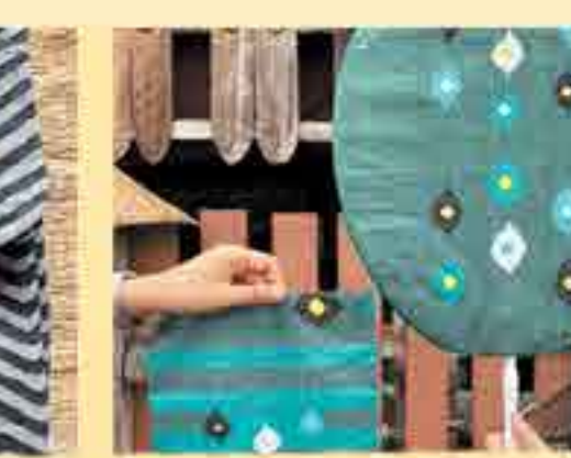
ตาลปัตรผ้าทอไทลื้อ