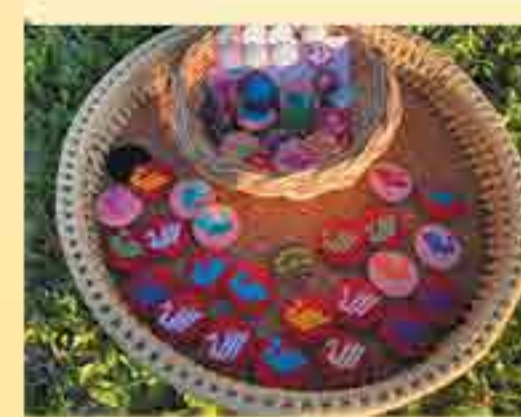
เพิ่มผลิตผ้าทอ