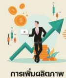
การเพิ่มผลผลิตภาพ