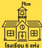
โรงเรียน 6 แห่ง ศพด. 2 แห่ง