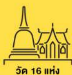
วัด 16 แห่ง