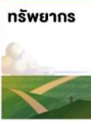
พื้นที่ 104 ตร.กม.