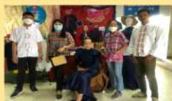
OTOP ตะกร้าหวายเทียม