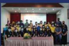
กิจกรรมการจัดทำแผนการพัฒนาภูมิภาคนิคมและสร้างอาชีพใหม่