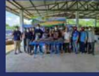
กิจกรรมส่งเสริมอาชีพกลุ่มปศุสัตว์เชิงอาชีพ