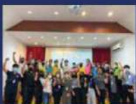
กิจกรรมการอบรมทักษะการบริหารงบประมาณ