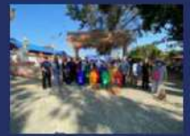
กิจกรรมส่งเสริมการจัดการที่สวนต้อมและพื้นที่ชุมชน