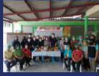
กิจกรรมส่งเสริมอาชีพกลุ่มทำขนม