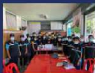
กิจกรรมการสำรวจและเฝ้าระวังโรคติดต่อไวรัส Covid - 19