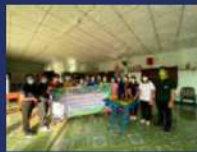
กิจกรรมส่งเสริมอาชีพกลุ่มสมุนไพร