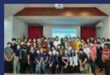
กิจกรรมเวทีวิเคราะห์สภาพแวดล้อมชุมชน