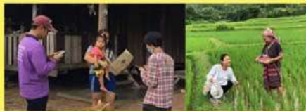
ลงพื้นที่สำรวจข้อมูล CBC (Community big data)