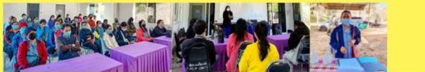
กิจกรรมการพัฒนาด้านสุขอนามัยเพื่อป้องกันภัยสุขภาพ ส่งเสริมพฤติกรรมสุขภาพที่เหมาะสมสำหรับผู้สูงอายุ