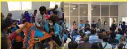
กิจกรรมโรงเรียนผู้สูงอายุ