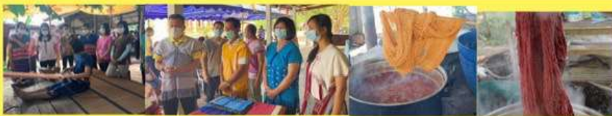
กิจกรรมกลุ่มย้อมสีธรรมชาติ ชุมชนต้นแบบ บ้านไม้ตะเคียนหมู่ที่ 2