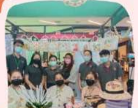
นิทรรศการแสดงผลงาน