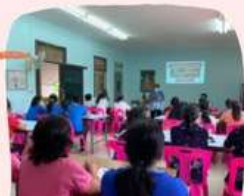
การให้ความรู้และป้องกันโรค COVID-19