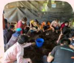
การเก็บข้อมูลเบื้องต้นและการคิดต้นทุนเบื้องต้น