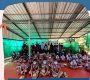
เกษตรกรที่รู้ผู้เชี่ยวชาญ