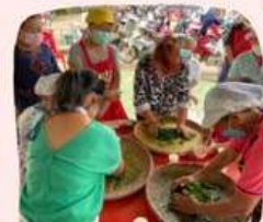
การพัฒนาผลิตภัณฑ์ชาผักหวานท้องถิ่น