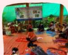
การอบรมกระเป๋าสานเส้นพลาสติก