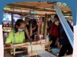
การพัฒนาผลิตภัณฑ์ผ้าทอพื้นเมือง