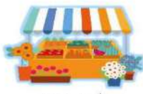
ตลาด 1 แห่ง

ประชากรส่วนใหญ่มีอาชีพเกษตรกรกรรรม ส่วนใหญ่นิยมปลูกข้าว มันฝรั่ง ข้าวโพด