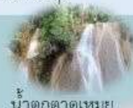
น้ำตกตาดเหมย