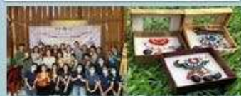
กิจกรรมทำบรรจุภัณฑ์