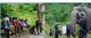
กิจกรรมพัฒนาปางช้าง