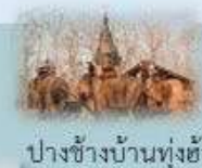
ปางช้างบ้านทุ่งช้าง