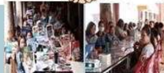
กิจกรรมเทคนิคการใช้สี