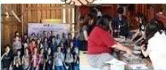
ผลิตภัณฑ์ จากเมล็ดมะค่า