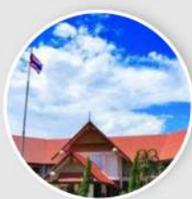
โรงเรียน 6 แห่ง