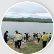
แหล่งน้ำ 2 แห่ง

ตำบลเกาะคา ตั้งอยู่ในพื้นที่อำเภอเกาะคา ติดกับพื้นที่ของ 4 ตำบล คือ ตำบลท่าผา ตำบลนาแก้ว ตำบลไหล่หิน และตำบลลำปางหลวง ตำบลเกาะคา ตั้งอยู่ในเขตภาคเหนือตอนบนอยู่สูงจากระดับน้ำทะเลประมาณ 270 เมตร สภาพพื้นที่โดยทั่วไปเป็นที่ราบริมฝั่งแม่น้ำ โดยมีแม่น้ำแม่วังไหลผ่านตรงกลางพื้นที่ห่างจากกรุงเทพฯ ตามเส้นทางหลวงแผ่นดินสายพหลโยธิน สายเอเชียประมาณ 590 กิโลเมตร