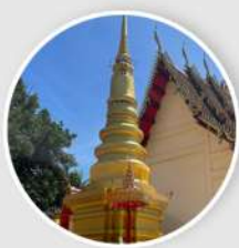
วัด 7 แห่ง