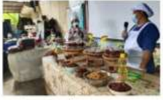
โครงการพัฒนารูปแบบผลิตภัณฑ์ นำนริกกุ้งขาว