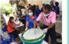
โครงการแปรรูปข้าวราวีเวอร์รี่