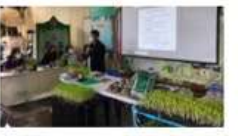
โครงการพัฒนาทักษะอาชีพใหม่(เพาะต้นอ่อน)