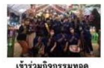
เข้าร่วมกิจกรรมทอดพระป่าทางน้ำและประเพณีลอยกระทง