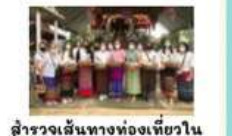
สำรวจเส้นทางท่องเที่ยวในซอกกิจกรรม "หลักทิวทันเดียวเที่ยวบ้านๆ"