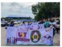
ลงพื้นที่ Covid Week