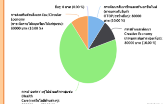
สัดส่วนงบประมาณสำหรับการพัฒนาตำบลในแต่ละประเภท