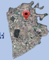
แผนที่แสดงตำแหน่งตำบลแก้งแก