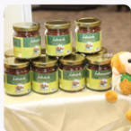
กิจกรรมการพัฒนาผลิตภัณฑ์อาหาร