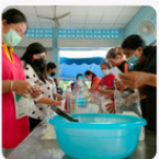
กิจกรรมอบรมสร้างผลิตภัณฑ์ใหม่ในชุมชน