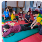
กิจกรรมอบรมตลาดเพื่อสุขภาพ