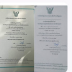
กิจกรรมยื่นขอเขียนกลุ่มวิสาหกิจชุมชน