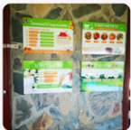
กิจกรรมพัฒนาอนามัยบ้านเพิ่มขึ้น