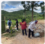
จัดกำลังสถานที่จุดยึดอินทร์ประจำหมู่บ้าน