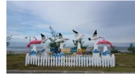
หาดทรายเม็ดแรก