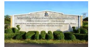
โครงการแหลมผักเบี้ย