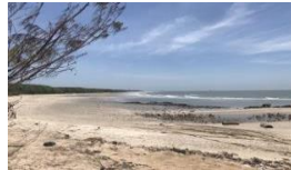
หาดแหลมหลวง