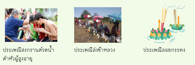
ประเพณีสงกรานต์รดน้ำดำหัวผู้สูงอายุ ประเพณีสังข์ข้าหลวง ประเพณีลอยกระทง