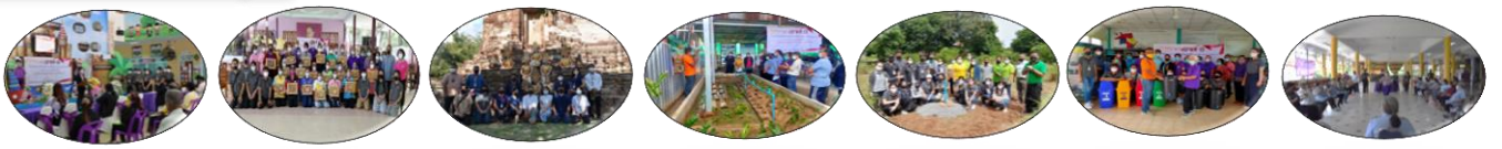
ประเมินชุมชนท่องเที่ยว หงส์ ของที่ระลึก ท่องเที่ยวเมือง 3 ธรรม การเลี้ยงปูนา ธนาคารน้ำใต้ดิน ถังน้ำหมักชีวภาพ ระบบสุขภาพ อสม.