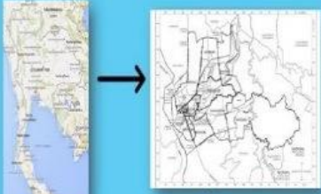
แผนที่ ตำบลบ้านกร่าง