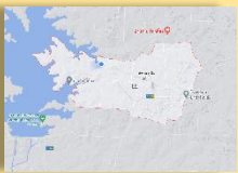
แผนที่ ตำบลภูดิน