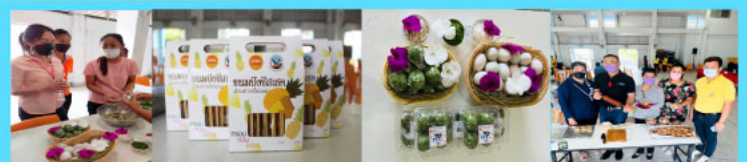
การพัฒนาผลิตภัณฑ์ เพื่อรองรับนักท่องเที่ยวภายในชุมชนตำบลไร่เก่า อำเภอสามร้อยยอด จังหวัดประจวบคีรีขันธ์