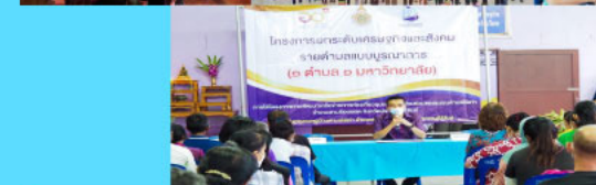
ท่านนายอำเภอให้เกียรติเป็นประธานในพิธีกล่าวเปิดการสัมมนาโครงการ "การพัฒนาเครือข่ายการท่องเที่ยวชุมชนแบบมีส่วนร่วมของชุมชนตำบลไร่เก่า อำเภอสามร้อยยอด จังหวัดประจวบคีรีขันธ์"