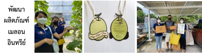
พัฒนา ผลิตภัณฑ์ เมลอน อินทรีย์