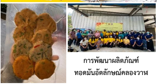
การพัฒนาผลิตภัณฑ์ ทอดมันอัตลักษณ์คลองวาฬ