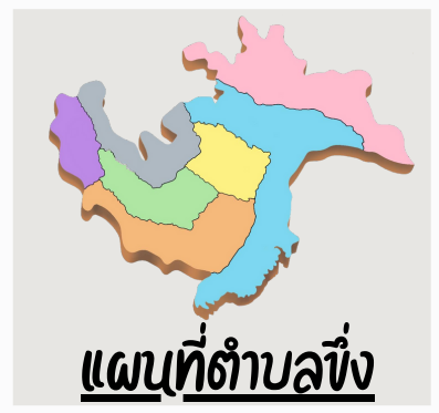
แผนที่ตำบล