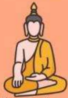
วัด 3 แห่ง