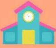
โรงเรียน 3 แห่ง