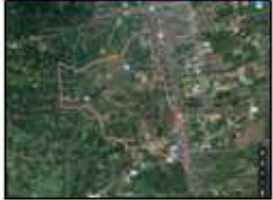
แผนที่ตำบลมะม่วงสองต้น

ตำบลมะม่วงสองต้น เป็นที่อุดมสมบูรณ์ทางธรรมชาติ เต็มไปด้วยพันธุ์ไม้หลากหลายชนิด มีลักษณะเป็นพื้นที่ราบบางส่วนซึ่งเป็นที่ดอน แต่โดยทั่วไปสภาพภูมิประเทศทั้งสองลักษณะจะจัดกระจายและปะปนกันจนมองไม่ออกเห็นความแตกต่างที่ชัดเจน มีลักษณะพื้นที่โดยทั่วไปเป็นพื้นที่ราบ สภาพพื้นที่จึงเป็นดินเหนียวบนที่ราบเหมาะแก่ การทำ การเกษตร มีคลองธรรมชาติเป็นคลองสาบหลัก คือ คลองท่าดี คลองสอน