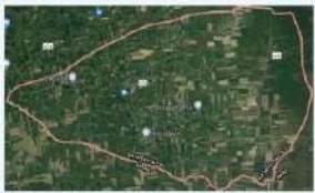
แผนที่ ตำบลหนองหาด

ตำบลหนองหาด อยู่ห่างจากตัวจังหวัดนครศรีธรรมราชไปทางทิศใต้ประมาณ 80 กิโลเมตร มีพื้นที่ประมาณ 58.53 ตร.ม หรือประมาณ 36,572 ไร่