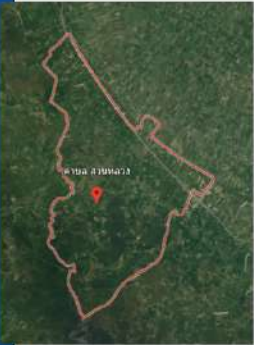
แผนที่ ตำบลสวนหลวง

พื้นที่ทั้งหมด จำนวน 88.00 ตร.ม หรือประมาณ 22,687.50 ไร่