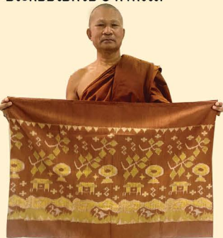
กิจกรรมที่ 1

มีการดำเนินกิจกรรมให้สอดคล้องกับบริบทในชุมชน ประกอบไปด้วย 5 กิจกรรม