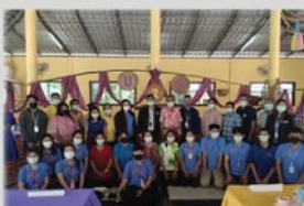
กิจกรรม อบรมพัฒนาอาชีพ