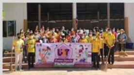
กิจกรรมการลงพื้นที่ ก้าวต่อไปสู่ภัยโควิด