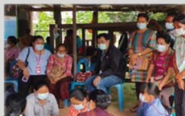
กิจกรรม การอบรมหลายหมู่บ้าน