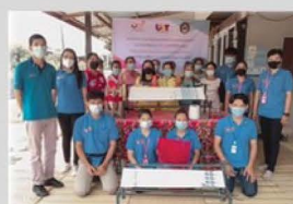
กิจกรรม อบรมกลุ่มอาชีพผ้าไหม