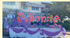
การยกระดับการท่องเที่ยว มอบป้ายอักษร บึงห้วยทะเล เพื่อเป็นแลนด์มาร์คถ่ายรูป