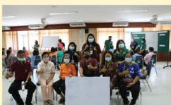
จัดอบรมเชิงปฏิบัติการเพื่อการส่งเสริมเศรษฐกิจฐานในชุมชน หาข้อมูลการพัฒนา อาชีพในชุมชน