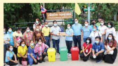
อบรมเชิงปฏิบัติการเพื่อส่งเสริมการดูแลสุขภาพของประชาชน ประชาชนในตำบลมีความรู้เพิ่มเติม