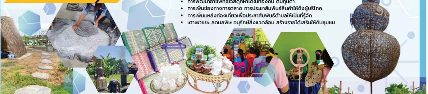
มีการดำเนินกิจกรรมที่สอดคล้องกับบริบทในชุมชน ประกอบด้วย 5 กิจกรรม