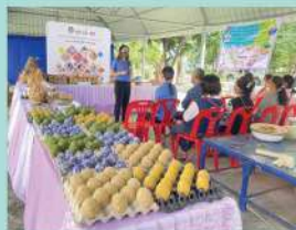
การพัฒนาอาชีพตามอัตลักษณ์ท้องถิ่น เพื่อเพิ่มมูลค่าสินค้า