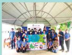
การถ่ายทอดองค์ความรู้เพื่อสร้างงาน สร้างอาชีพ และสร้างรายได้