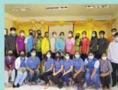
กิจกรรมการพัฒนาช่องทาง การตลาดออนไลน์