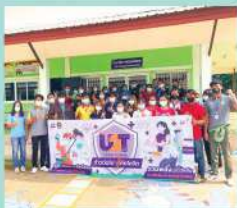
กิจกรรม U2T ก้าวต่อไปสู้ภัยโควิด (COVID-19 WEEK)