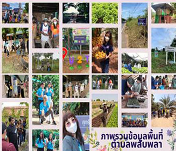
ภาพรวมข้อมูลพื้นที่ตำบลพลับพลา