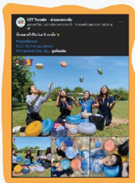
การพัฒนาช่องทางทางการตลาดออนไลน์