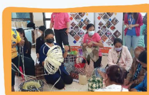
การถ่ายทอดองค์ความรู้เพื่อสร้างอาชีพ สร้างงาน สร้างรายได้