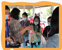
เข้าระวังโควิด