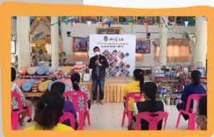
การพัฒนาอาชีพเพิ่มมูลค่าสินค้า