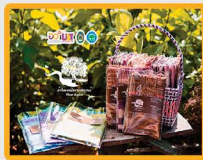
กิจกรรมการพัฒนาอาชีพ ตามอัตลักษณ์ท้องถิ่น เพื่อเพิ่มมูลค่าผลิตภัณฑ์ผ้าไหม