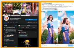
กิจกรรมการพัฒนาช่องทางทางการตลาดผลิตภัณฑ์ผ้าไหมผ่านทางออนไลน์