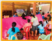
กิจกรรมการถ่ายทอด องค์ความรู้ผลิตภัณฑ์ผ้าไหม