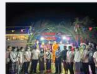
ทดลองเปิดตลาดชุมชน