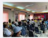
ประชุมหารือเพื่อค้นหาผลิตภัณฑ์