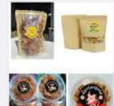
ออกแบบบรรจุภัณฑ์และโลโก้ตามอัตลักษณ์ชุมชน