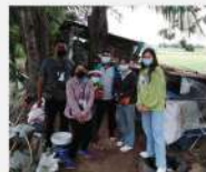
ลงพื้นที่เก็บข้อมูลตำบล