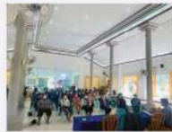
จัดอบรมและหารือเกี่ยวกับการจัดตั้งตลาดชุมชน