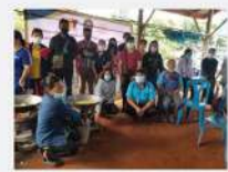
พัฒนาผลิตภัณฑ์ (กล้วยฉาบ, กล้วยเบรคแตก, กล้วยเชื่อม)